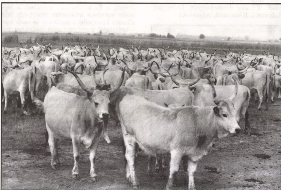
Magyar szürke gulya

Védjük vagy ahol lehetséges és szükséges, újraélesztjük azokat a kismesterségeket, illetve foglalkozási ágakat, ame-