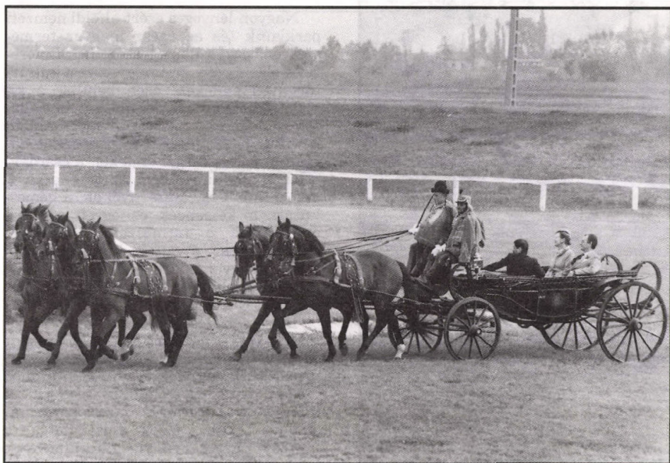
Királyi vendég a pusztán: Margit dán királynő férjével

ugyancsak a távolról jövőknek kell megvédeni. Jellemző például, hogy a debreceni ember ugyanúgy nem tiszteli különösebben a füves pusztát, mint az afrikai a zsiráfot. A Debrecenben lakók zömének a Hortobágy a nagy semmit jelenti. Nyilvánvalóan ennek „köszönhető” az is, hogy a Hortobágy nemzeti parkká nyilvánítására a leghatározottabban külföldi szakemberek tettek javaslatot.