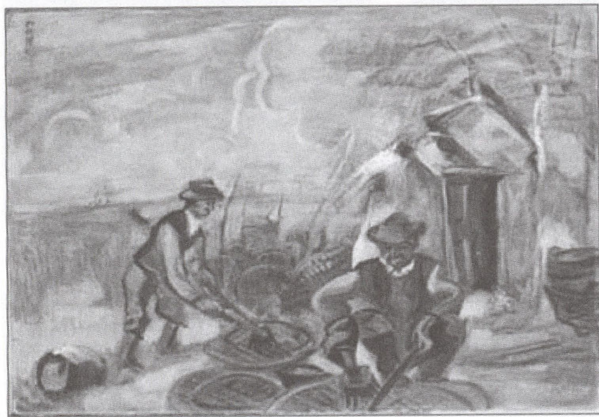
Boromisza Tibor: Varsázók

szeti tanulmányokat, s azokat Rómában (1904), Párizsban (1905), Münchenben (1906) folytatta. A Nagybányai Művésztelepen saját csoportja volt, 1908-ban részt vett a balatoni festőtelep alapításában. Az 1920-as évek első felében buddhista szerzetesként élt a Margitszigeten, a nyüzsgő élettől való elvonuláshoz jól illett a Hortobágyra való kitelepedés is, ahol a pásztorok életét ugyanúgy tanulmányozhatta és festhette, mint a természet és az ember metaforikus kapcsolatát. Művészeti írói tevékenysége szintén ismert – több lap munkatársaként működött, 1913-ban megalapította az Eke című folyóiratot. Számos kiállítást rendezett az ország különböző nagyvárosaiban, 1948-ban pedig Budapesten, a Művész Galériában. Szentendrén telepedett le, ott is halt meg. Műveit a Magyar Nemzeti Galéria ( Csikós számadó, Juhász számadó, Kucsmás férfi, Anya gyermekével ) és a debreceni Déri Múzeum őrzi, s egyre többször felbukkannak festményei az aukciókon is.